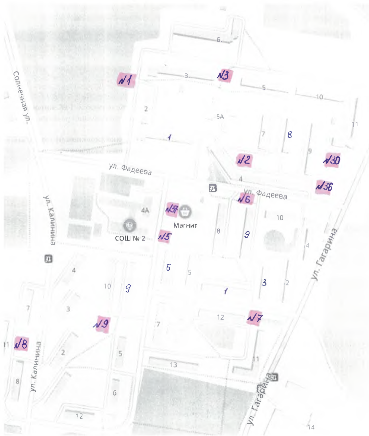
Схема мест (площадок) накопления твердых коммунальных отходов на территории городского поселения поселок Редкино по состоянию на 01.03.2021 г.

№ - номер места (площадки) накопления твердых коммунальных отходов на территории городского поселения поселок Редкино