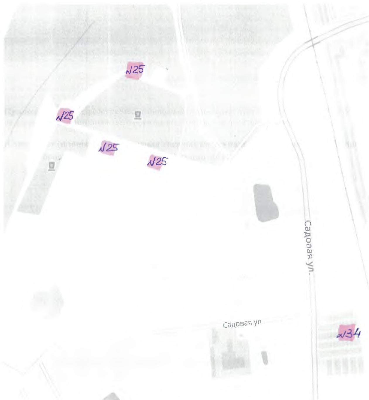
Схема мест (площадок) накопления твердых коммунальных отходов на территории городского поселения поселок Редкино по состоянию на 01.03.2021 г.

№ - номер места (площадки) накопления твердых коммунальных отходов на территории городского поселения поселок Редкино