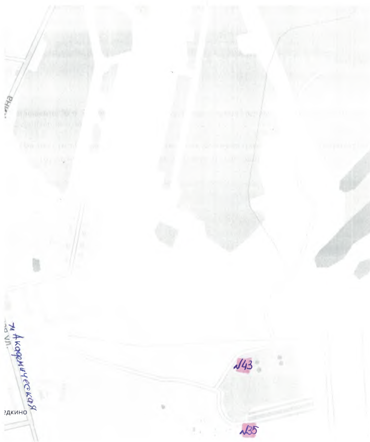
Схема мест (площадок) накопления твердых коммунальных отходов на территории городского поселения поселок Редкино по состоянию на 01.03.2021 г.

№ - номер места (площадки) накопления твердых коммунальных отходов на территории городского поселения поселок Редкино