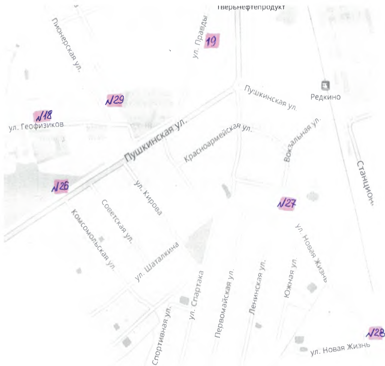
Схема мест (площадок) накопления твердых коммунальных отходов на территории городского поселения поселок Редкино по состоянию на 01.03.2021 г.

№ - номер места (площадки) накопления твердых коммунальных отходов на территории городского поселения поселок Редкино