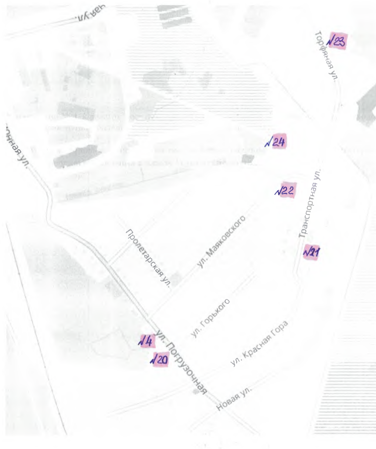
Схема мест (площадок) накопления твердых коммунальных отходов на территории городского поселения поселок Редкино по состоянию на 01.03.2021 г.

№ - номер места (площадки) накопления твердых коммунальных отходов на территории городского поселения поселок Редкино