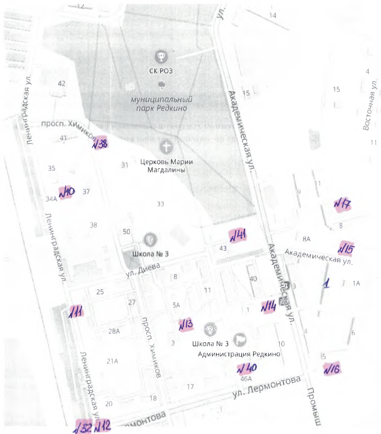
Схема мест (площадок) накопления твердых коммунальных отходов на территории городского поселения поселок Редкино по состоянию на 01.03.2021 г.

№ - номер места (площадки) накопления твердых коммунальных отходов на территории городского поселения поселок Редкино